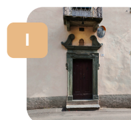
Nei pressi di una strettoia