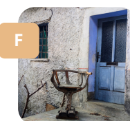
Una sedia d'altri tempi