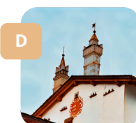
Guarda in alto!