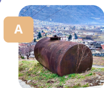
In cima ad una salita impervia

Quando trovi uno di questi tesori, scrivi la lettera corrispondente sulla mappa, nella casella più vicina al punto dove l'hai trovato. Le caselle verdi sono facoltative, consigliate solo ai bambini più grandi.