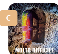
MOLTO DIFFICILE Tra le case antiche, vicino al ponticello