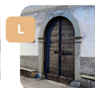
Un antico portone