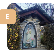
Nei pressi di un bivio